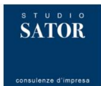
Convenzione servizi fiscali

Abbiamo continuato il nostro impegno nella creazione di una rete di convenzioni al fine di agevolare i nostri dipendenti consolidando quelle già in essere e creandone delle nuove: